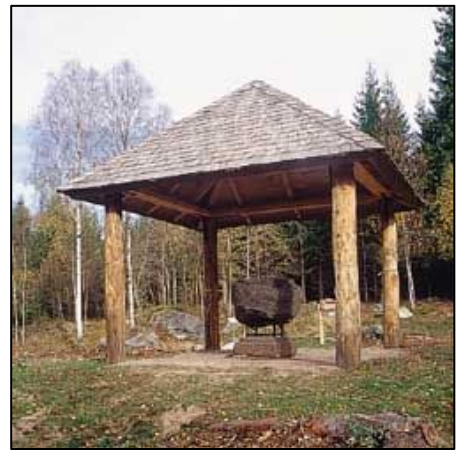
Funtaliden, källa www.ekomuseum.com

I Region Hallands Regionala Tillväxtprogram riktas resurserna till fem insatsområden. Ett av dem är upplevelsenäringen. Denna ges en bred definition och tre områden bedöms vara särskilt viktiga för besöksnäringens utveckling. Två av dem är naturupplevelser samt kultur och sevärdheter.