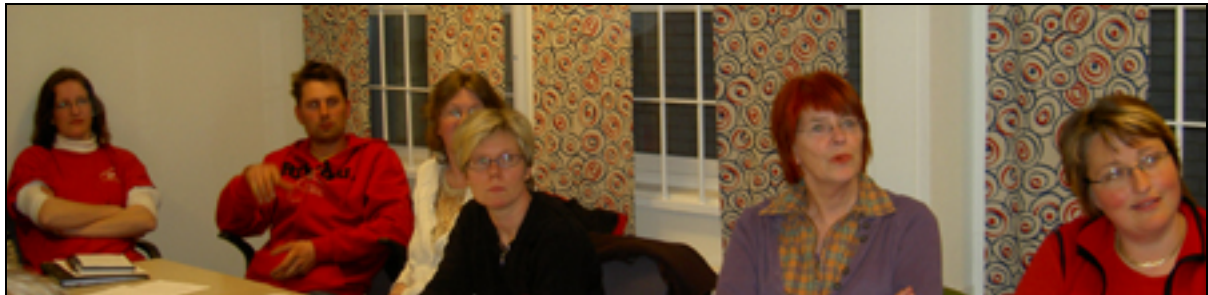
Några av deltagarna i utbildningen.