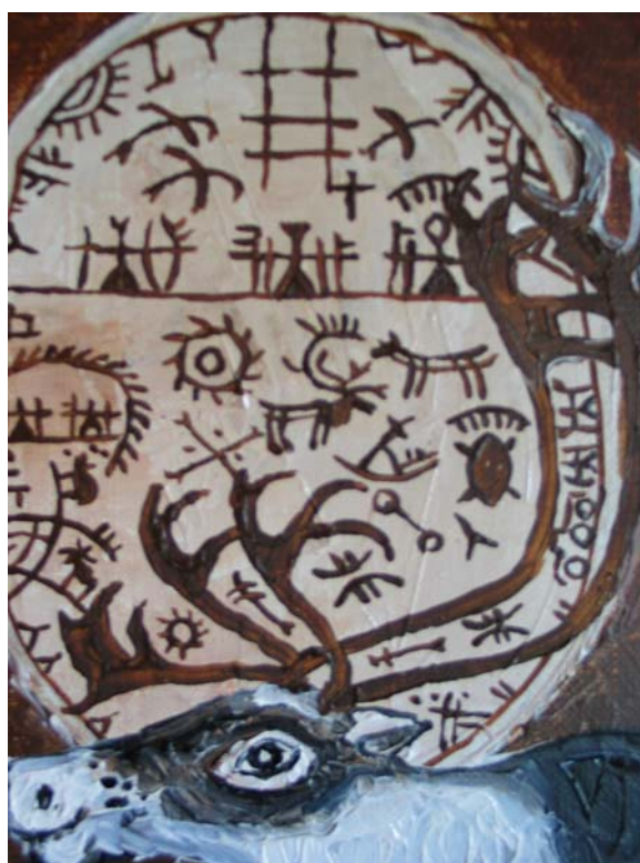
Del av konstverk, målat av Lars Pirak.

Ett samiskt näringsliv med hög attraktionskraft som präglas av utvecklingskraft och som får människor att växa. Sametinget