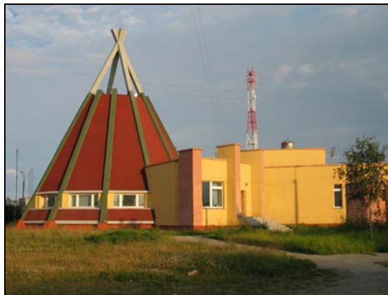
Det samiska centret i Lovozero, Ryssland

Flera webbplaster för samiska turistprodukter är "under uppbyggnad", är inte uppdaterade eller finns helt enkelt inte längre/är flyttade/inte går att ladda upp.